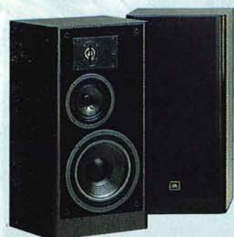
LX - 66