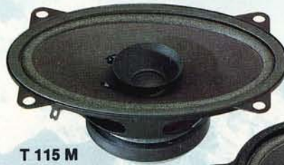
T 115 M

Il T545 ha terminali che permettono il collegamento ad un sistema biamplificato.