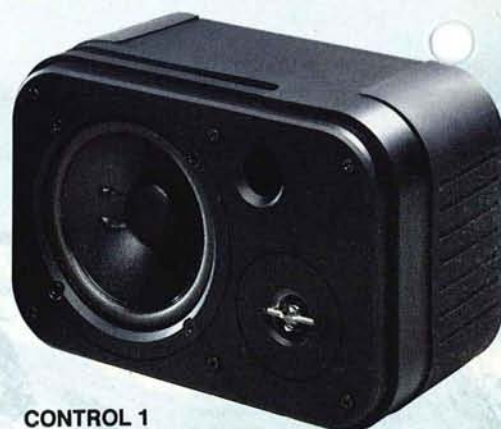
CONTROL 1 Monitors da banco di regia